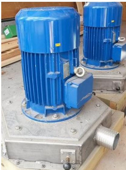
Pelton turbin med asynkron generator