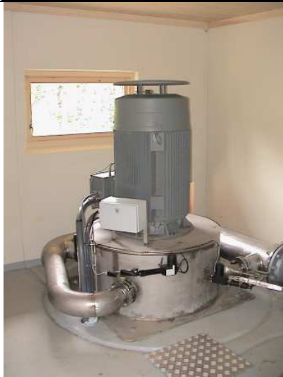
Bilde av tilsvarende turbin