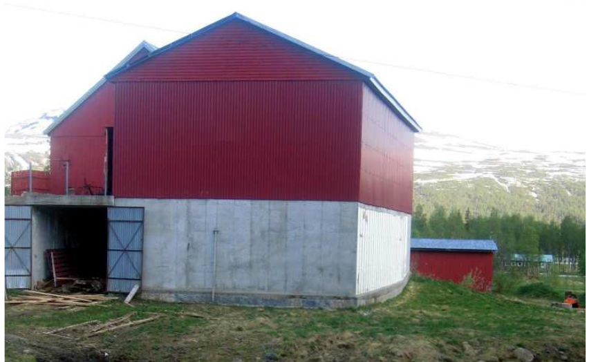
Kraftstasjon i gammel silo