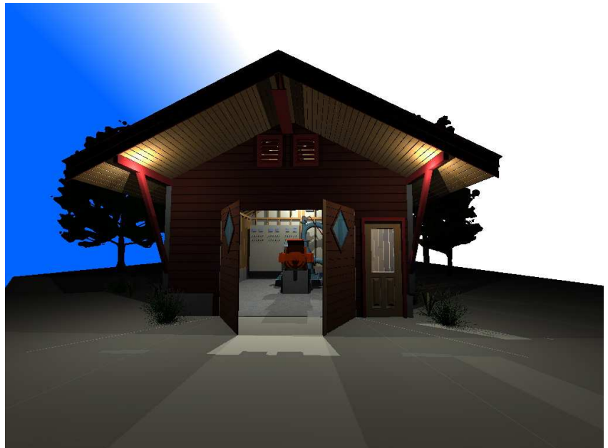
3D image med belysning